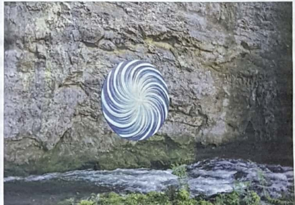
Po poti preobrazbe

nekoga pozitivno vpliva, tudi če ne ve, zakaj jo je prejel. Primer: možak alkoholik in še kaj se želi rešiti, žena izve, da ima Lanova slika na temo zdravljenja odvisnosti, »naslikala sem jo, ko sem bila štiri mesece v Indiji«. Odvisnikova žena je verjela, da mu bo slika pomagala, jo kupila, »in smo slišali, da je bil možak v dveh mesecih trezen in čist in nazaj v družini.« Žena je bila srečna, on ni vedel, kaj naj bi slika pomenila, a ker jo je kot dar spoštoval, se trudil, je delovala. Podobno je pri drugih darilnih slikah, Lanova omeni izjemne primere pri zagatah z neplodnostjo. Placebo, bi brez njega sploh kaj delovalo? »Pri darilnih slikah smo ugotovili, da ni placeba. Nas je razorožilo.«